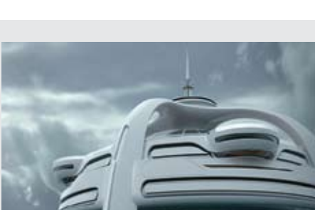
▲ «یوتوپیا» یا همان روبات شناور باقیمت حداقلی چند صد میلیون برای سال نهم مزایم گذشته شد

افزایش دمای هوا در مناطق کوهستانی اتریش، سبب ذوب شدن برف‌ها و تعطیلی پیست‌های زمستانه اسکی تیرول و سایرورگ شده‌است. از آنجا که این پیست‌ها جزء پنج مرکز مهم اسکی جهان محسوب می‌شوند و سالانه هزاران گردشگر را به این کشور می‌کشاند گرمای هوا سولتان را بسیارنگران کرده‌است. فصل اسکی در اتریش از اواسط دسامبر آغاز می‌شود اما به این لحظه این مکان‌ها به هیچ‌وجه آماده‌ای کار نشده‌و هواناسان اولین بارش‌ها را تا یکی دو ماه آینده پیش‌بینی می‌کنند.