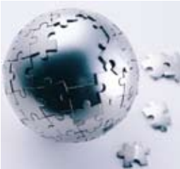
باید توجه داشت که برخی

اول این که ویکی‌پدیای فارسی برخلاف بسیاری از ویکی‌پدیا‌های هم‌رده خود، عموماً با کمبود تصویر روبه‌روست. از آنجا که تصاویر باید با رعایت حق تکثیر در ویکی‌پدیا قرار گیرند، بخش اعظم تصاویر ویکی‌پدیای فارسی، تصاویری است که خود کاربران این دانشنامه تهیه کرده‌اند.